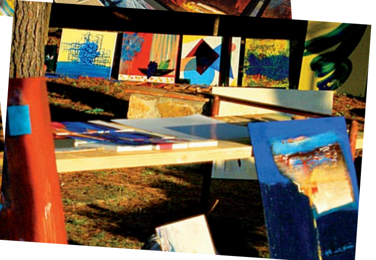
krönender Abschluss: Vernissage