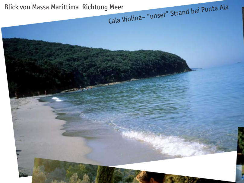
Cala Violina- "unser" Strand bei Punta Ala