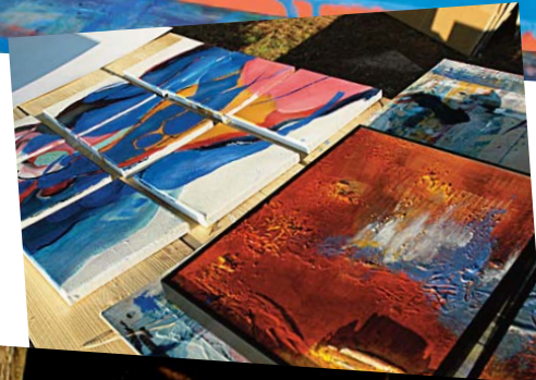
"Freiluftatelier" in der Pineta