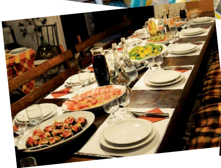
und abends... "a tavola...."