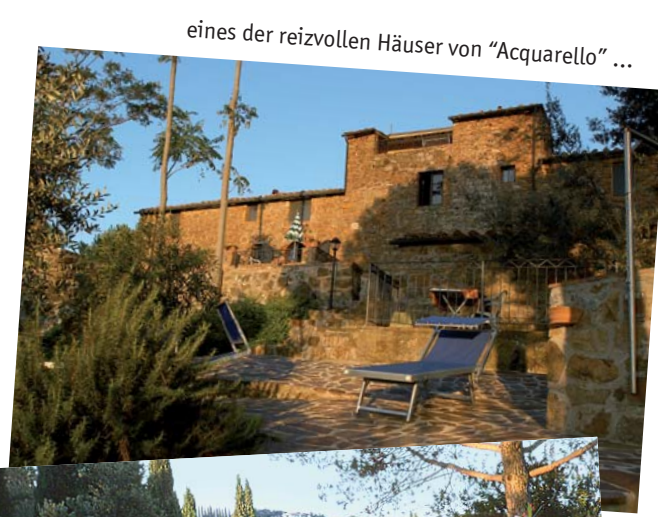
eines der reizvollen Häuser von "Acquarello" ...