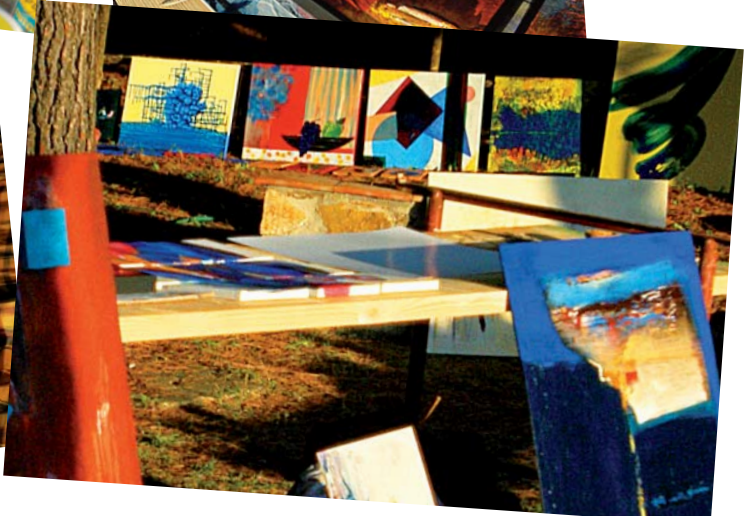
krönender Abschluss: Vernissage