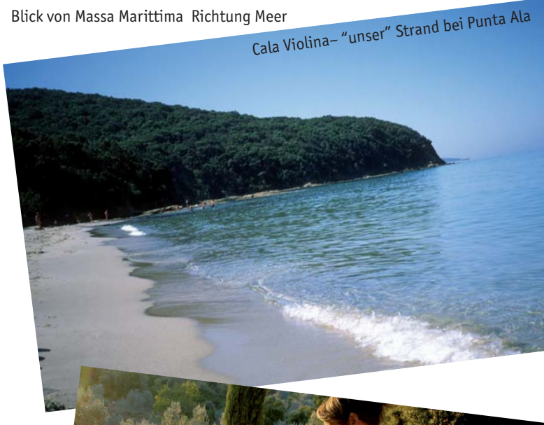
Cala Violina- "unser" Strand bei Punta Ala