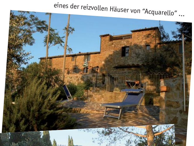
eines der reizvollen Häuser von "Acquarello" ...